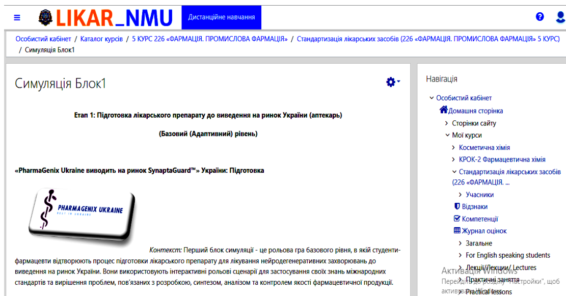
Рис. 3. Приклад розміщення на дистанційній платформі LIKAR_NMU симуляції до навчальної дисципліни «Стандартизація лікарських засобів»

На рис. 3 представлено приклад фрагменту симуляції до теми 1 «Міжнародні принципи стандартизації процедури розробки, синтезу та аналізу фармацевтичної продукції», у якій із застосуванням методу гейміфікації розглядаються міжнародні принципи стандартизації процедур розробки, синтезу та аналізу фармацевтичної продукції, стратегія Всесвітньої організації охорони здоров'я в системі забезпечення та гарантування якості лікарських засобів, а також принципи міжнародних належних практик у фармації, таких як GXP (GLP, GCP, GMP, GSP, GDP, GPP, GPCL), включаючи принципи і правила GMP ЄС, GMP BOO3 та GMP PIC.