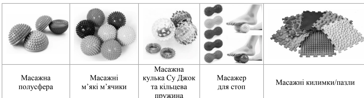
Рис. 1. Засоби Су-Джок терапії у роботі з дітьми раннього віку

Одним із прийомів цієї технології, що використовується з дітьми переддошкільного рівня, є масаж, у процесі якого і відбувається стимулювання біологічно активних точок (БАТ). Для того щоб цей процес був для дитини цікавішим, вихователем можуть використовуватися потішки, примовки, віршовані твори, музичні пальчикові ігри, казки, а також різні засоби Су-Джок терапії: масажні кульки («каштан») й кільця, масажні килимки та пазли, доріжки здоров'я тощо (Гнізділова, Бурсова, 2022) (рис. 1).