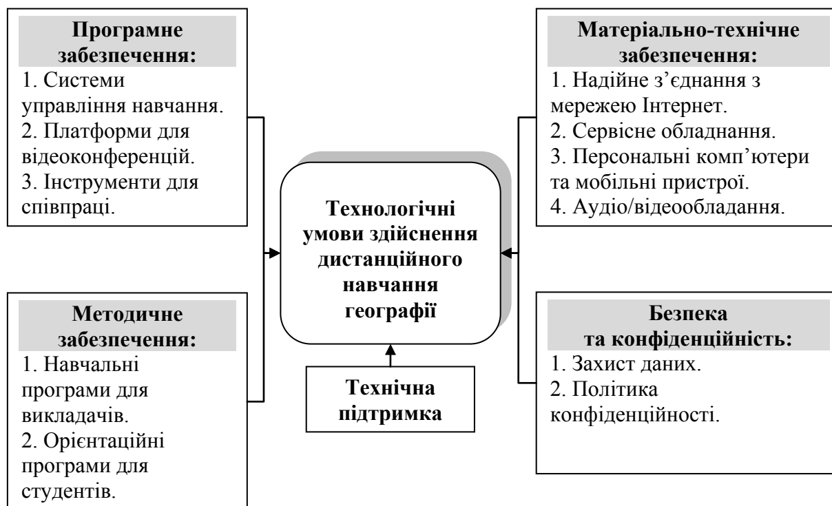
Рис. 1. Модель компонентів технологічних умов здійснення дистанційного навчання географії

Програмне забезпечення є фундаментом дистанційного навчання, адже на ньому ґрунтується проведення занять, оцінювання навчальних досягнень, комунікації між викладачами та студентами, а також доступ до навчальних матеріалів. Вибір якісного програмного забезпечення дозволяє гарантувати стабільність процесу навчання, його ефективність та зручність користування для всіх учасників. До програмного забезпечення варто включити системи управління навчанням, платформи для організації відеоконференцій та інструмента для співпраці.