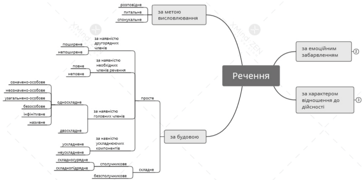
Рис. 1. Ментальна карта «Послідовність розбору речення».

На уроках української літератури у закладах професійно-технічної освіти ментальні карти доцільно застосовувати на етапі закріплення пройденого матеріалу. Вони підходять і для запам'ятовування великих обсягів інформації, і структурування прочитаного твору та його аналізу, і запам'ятовування основних фактів і слів, аналізування подій, характеристики образів, визначення проблематики у прочитаному тексті, підбиття підсумків тощо. Тобто йдеться не про звичайне запам'ятовування чи запис, а про осмислене сприйняття, швидше й глибше розуміння, що дозволяє відтворювати знання навіть через тривалий проміжок часу.